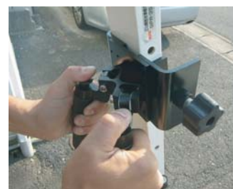
ワンタッチ伸縮レバー