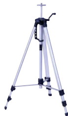
■ エレベーター三脚 LET-B