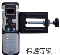
■ 受光器クランプセット RE-20IP / RC-2