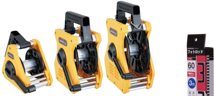
S M N

引き出す際にボディにテープが触れることなく 50mロッドでもスムーズに軽く引き出し・巻取れます。