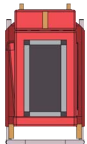
サイズ調整用クッション