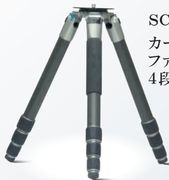
SCF444 カーボン ファイバー製 4段階