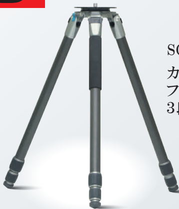
SCF343 カーボン ファイバー製 3段階