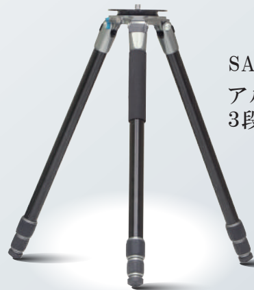
SAL343 アルミ製 3段階