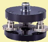
水平微調整三脚アダプター RL-TB