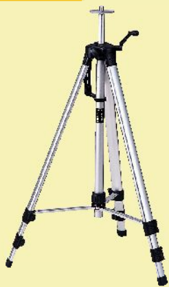
エレベーター三脚 LET-B