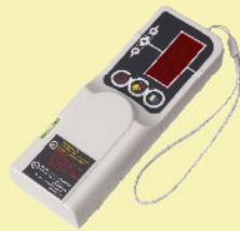
受光器(クランプ付) TL-RE