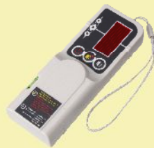
受光器(クランプ付) TL-RE