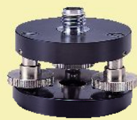
水平微調整三脚アダプター RL-TB