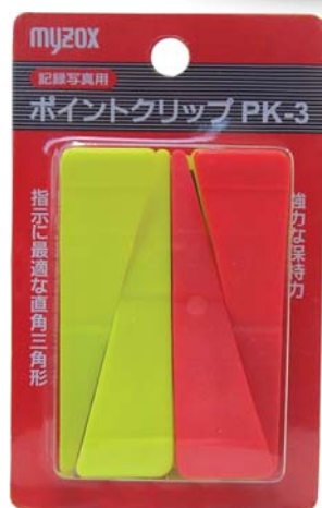
ブリスターパック

ズレ防止の ゴム が付いて 保持力が 強力 になりました。 指示に最適な 直角三角形 。