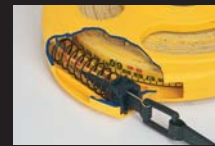
ストレートダンパー