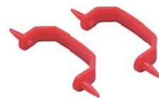
専用指標 2ヶ (MG-1000SPのみ)