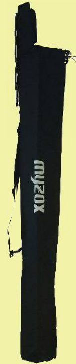
RTK ポール+バイポット 収納ケース