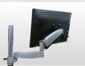
▲アームスタンドなど、多くの商品が VESA 規格に対応している。