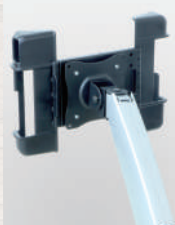
▲アームスタンド(別売)に取付