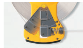
スイングダンパー