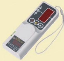
受光器(クランプ付) TL-RE