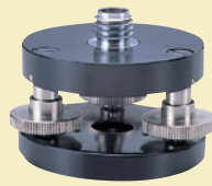
水平微調整三脚アダプター RL-TB