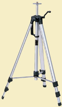
エレベーター三脚 LET-B