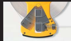
スイングダンパー機構