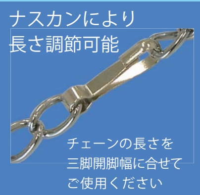
ナスカンにより 長さ調節可能