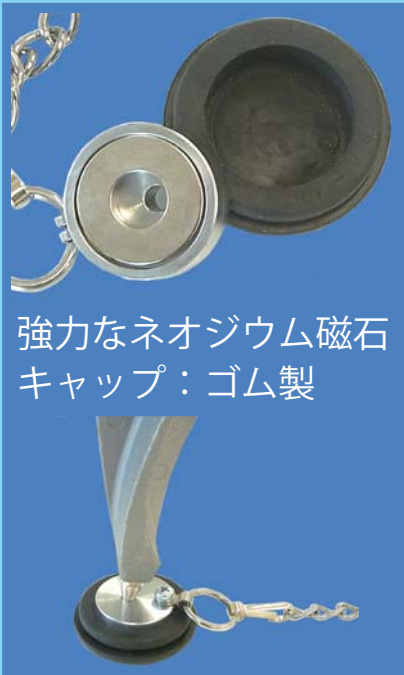
強力なネオジウム磁石 キャップ：ゴム製