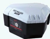
GEO WALKER PRO