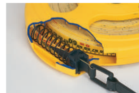
ストレートダンパー