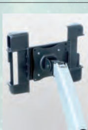
アームスタンド(別売)に取付