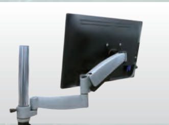
アームスタンドなど、多数の商品が VESA 規格に対応。