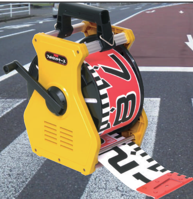
Photo Rod JIS 1級 フォトロード